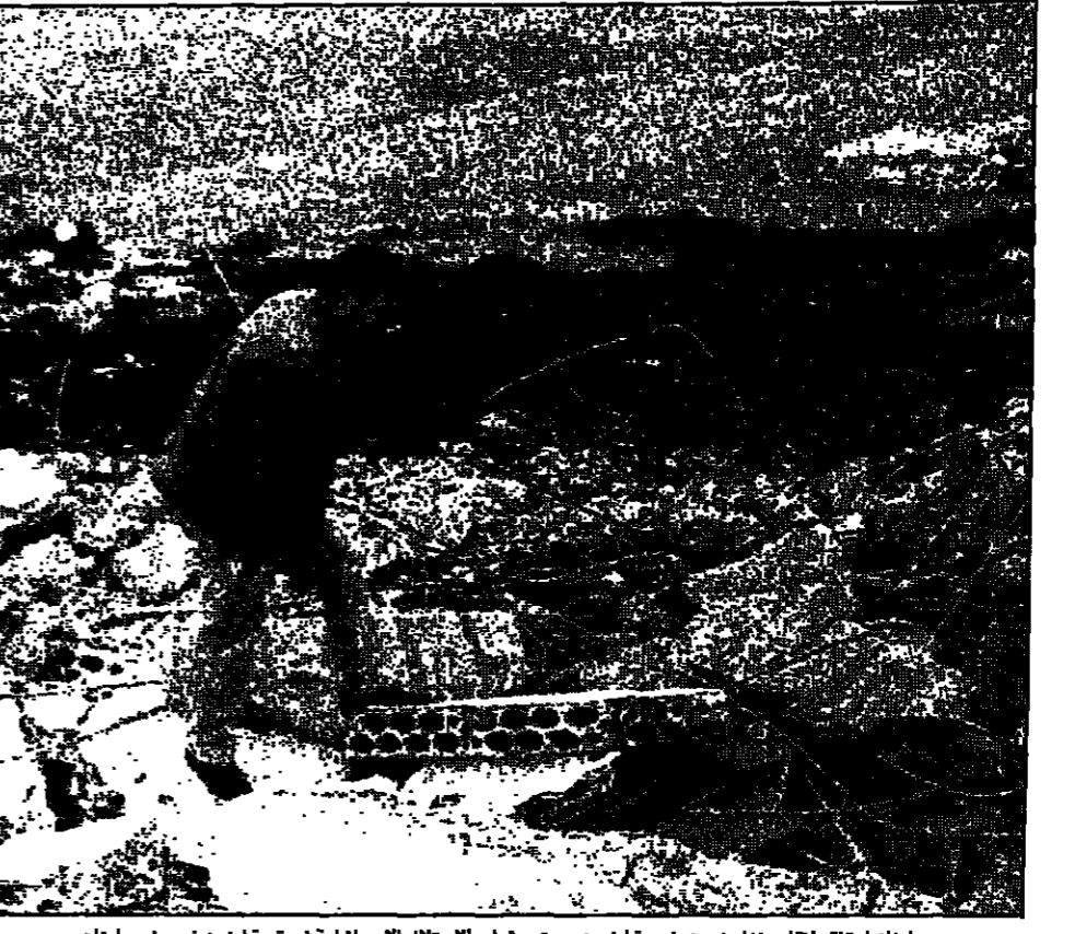
لبنانيان يتفقدون آثار منزل ضمن خمسة مرتفعات قوات الاحتلال الاسرائيلية في قرية لرتين في جنوب لبنان

ارتوت (لبنان) - صيدا - ويترن - ف: قال مصدر املي ان القوات الاسرائيلية قصفت مواقع ويقصفه انها تابعة للقوات الجوية ارتوت ومواقع جنوب لبنان، اسب الاثني عشر من سوت بالقرارات قصفت منازل غير مأهولة بالقوة. وقد عرّضت خرابية القصف التي حكمتها اسرائيل بالجنوب اللبناني، قامت حركة أمل الضميمة في وقت سابق في بيان انها هاجمت دورية اسرائيل داخل المنطقة المحيطة الا انه لم يرد تأكيد مستقل للهجوم. ويجده الهجوم على عربون بعد اقل من اسبوع من غارة اسرائيليه قتلت سبعة مدنيين وسبعت مائة مائة قتلى جامعة حزب الله وهي الغارة التي نفذت الجماعة المنوطة من ايران التي اطلق وايل من صواريخ الكاتوشا على شمال اسرائيل. ويقتضي اتفاق لوقف إطلاق النار الذي تم في نيسان (أبريل) عام 1996 هجمات اسرائيليه استمرت 17 يوما على لبنان وفتح اسرائيل وبقاويين من مهاجمة أهداف مدنية. ويقتل حزب الله وجماعات اخرى لعقد القوات الاسرائيلية وميليشيا جيش لبنان الجنوبي للتحالف معها في الشريط الحدودي للجنوب اللبناني، وعقد 15 كيلومترا. وتقول اسرائيل انها مستعدة للانسحاب تدريجيا لقرار مجلس الامن الدولي رقم 425 لعام 1978 اذا نشر لبنان جيشه في الجنوب ونزع سلاح جماعة حزب الله. ويصر لبنان وسورية على انسحاب اسرائيل غير مشروط بموجب القرار 425. ومن جهة اخرى ذكرت صحيفة اسرائيلية مناهضة للاحتلال العسكري اسرائيليه ان جنوب لبنان وجماعة حزب الله اللبنانيي اعلان هذبة مؤتمنة الى حين التراجع الحكومة الاسرائيلية بالانسحاب من الشريط الذي تحتله في جنوب لبنان، وقال مجيد قزامل الناطق باسم حركة جوارى اموته الاسرائيلية انه بحث بارسالة الى الامين العام لحزب الله الشيخ حسن نصرالله